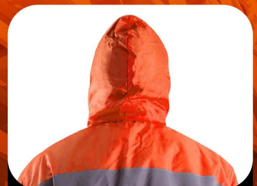
CUENTAN CON GORRO DESPLEGABLE