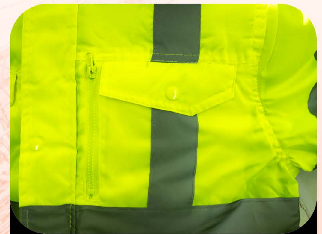
BOLSILLOS CON CIERRE Y VELCRO