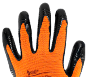
Dorso descubierto Respirable