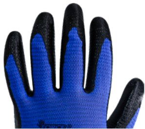
Dorso descubierto Respirable