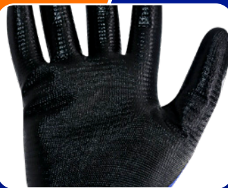
Palma con revestimiento liso de Nitrilo