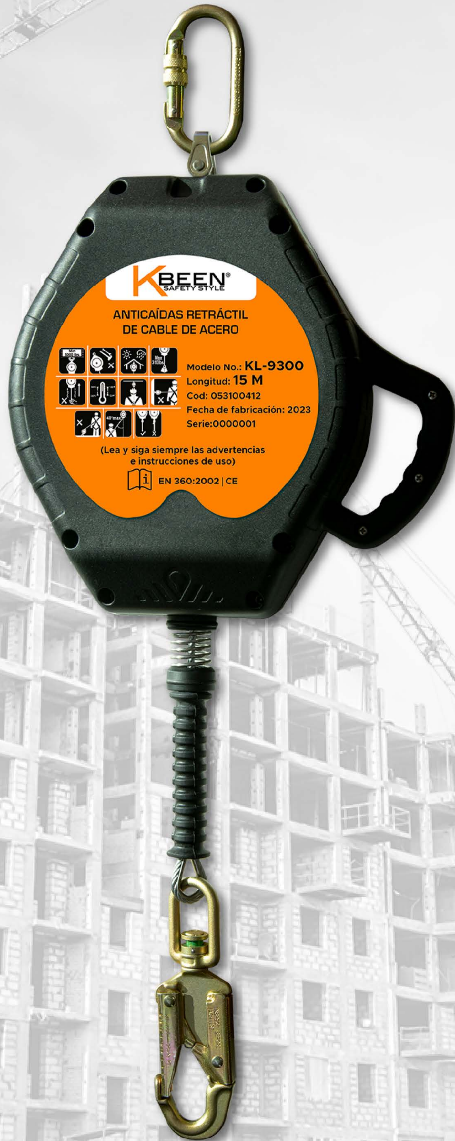
TESTIGO DE CAÍDA