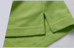
Terminación Tajali en costados