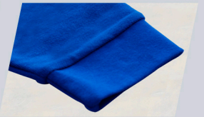
Manga larga con puño elástico