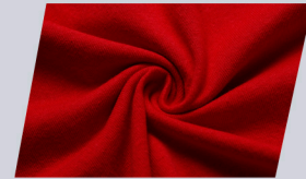
Tela suave y fresca