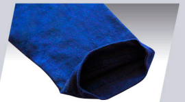
Manga larga con puño ribeteado