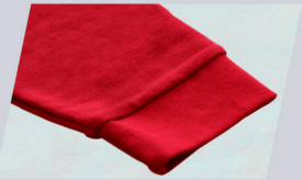
Manga larga con puño elástico