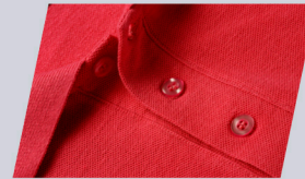
Cuello camisero con tres botones