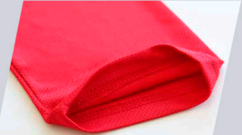
Manga corta con ribete en el puño